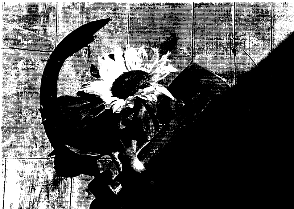
Hommage an Tina Modotti